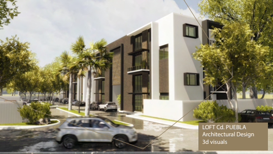
LOFT Cd. PUEBLA Architectural Design 3d visuals